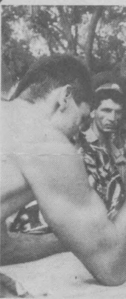
Так кто сильнее?..