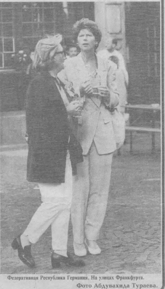
Федеративная Республика Германия. На улицах Франкфурта.

Пожилый врач-итальянец, одышающийся в Альпах, заблудился в горах. На его поиски отправилась команда спасателей. Найти пропавшего им не стоило большого труда. Помогли обрывки упаковки печенья, фантики от конфет, консервные банки, которые остались на пути следования путешественника.