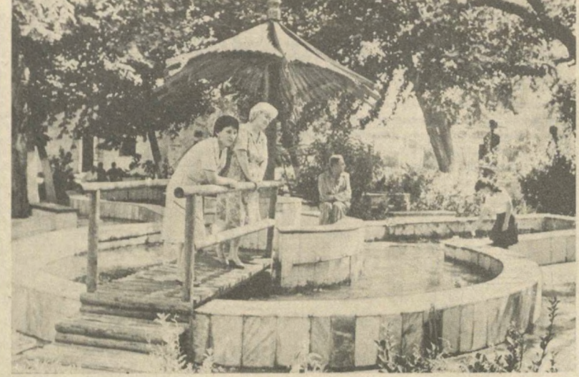
Санаторий-профилакторий Командского масло-молочного комбината пользуется большой популярностью у заводчан...