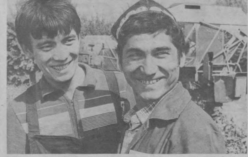
Высокому темпу уборки хлопка-сырца в колхозе «Узбекистан» Наринского района Наманганской области способствует работа механизаторов. Им предстоит собрать еще с половиной тысячи тонн сыра, что составляет 70 процентов вырванного урожая. НА СНИМКАХ: механизированная уборка