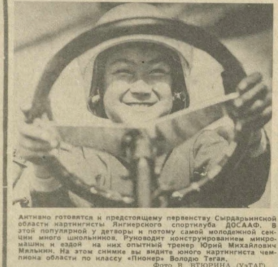
Активно готовятся к предстоящему первенству Сырдарьинской области гартингисты Инженерского спортулуба ДОСААФ...

Срок конкурсов — месяц со дня опубликования объявления.