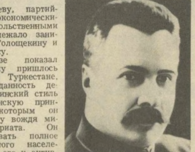
М. В. ФРУНЗЕ

В. В. Куйбышеву, партийной работой, экономическими и производственными вопросами надлежало заниматься Ф. И. Голощекину и Я. Э. Рудзутку.