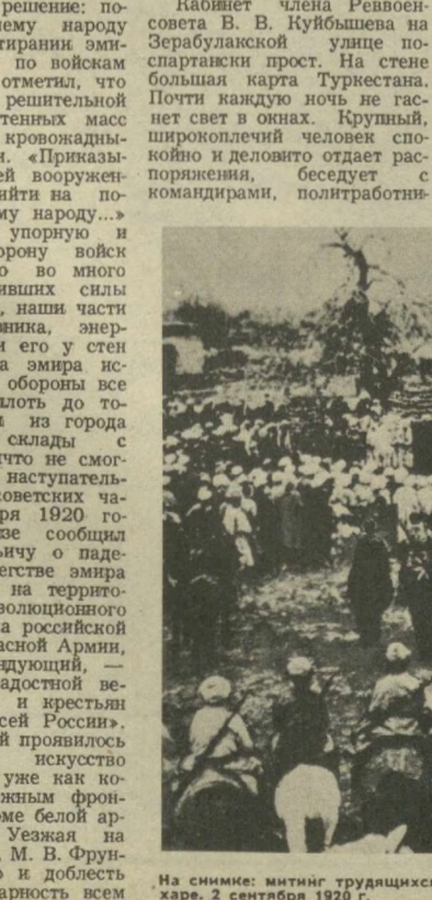
На снимке: митинг трудящихся и революционных войск после свержения власти эмира в Бухаре. 2 сентября 1920 г.