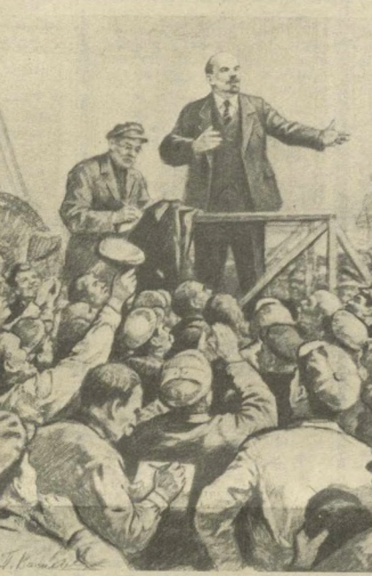
Выступление В. И. Ленина перед рабочими Обуховского завода (1917 г.). Рис. П. ВАСИЛЬЕВА.

КПСС; утвердились новые, социалистические производственные отношения; грандиозные перемены произошли в материальной и духовной жизни узбекского народа. Где теперь те горе-пропагандисты, что предсказывали нам прозябание в нищете и невежестве, те, кто твердил, что на преодоление безграмотности населения Туркестана понадобится 4600 лет!