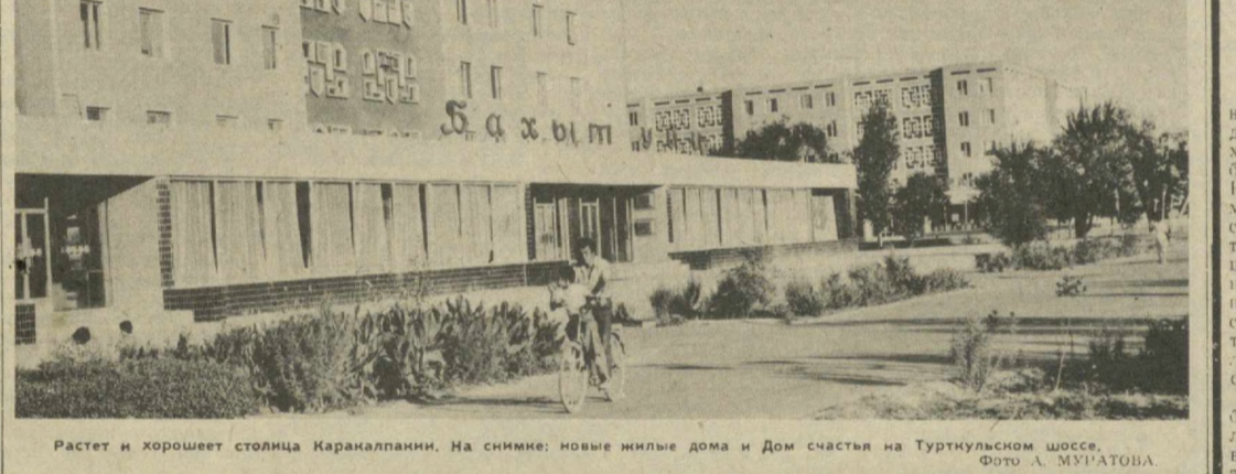
Растет и хорошеет столица Каракалпани. На снимке: новые жилые дома и Дом счастья на Турткульском шоссе.