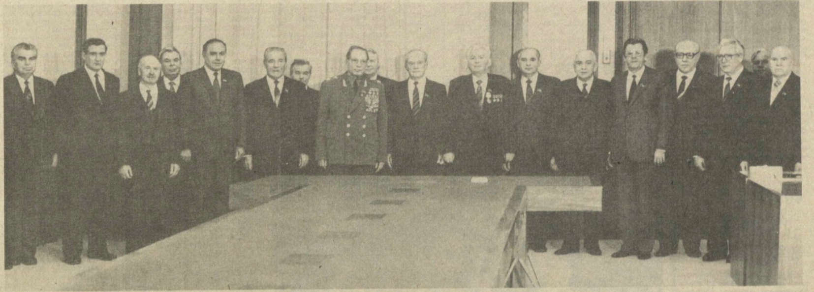
При вручении награды.

«Серп и Молот». По поручению Политбюро ЦК КПСС и Президиума Верховного Совета СССР награду вручил член Политбюро ЦК товарищ Д. Ф. Устинов. При вручении высокой награды тов. Д. Ф. Устинов выступил с речью.