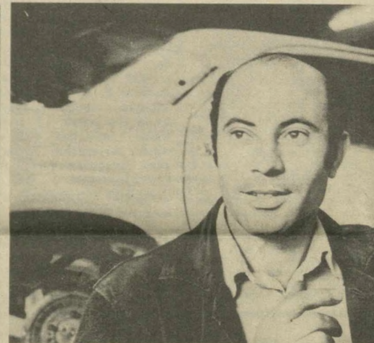
Мастерами своего дела славится Алмазский автомобильный завод № 6. Здесь капитально ремонтируют автомашины «ГАЗ-24» и микроавтомобили нескольких марок, причем ремонт всех узлов этих машин делают высококачественно. В этом году в строй будет возвраще-

3 октября в Кремле Председатель Совета Министров СССР Н. А. Тихонов принял вице-канцлера, федерального министра торговли, ремесел и промышленности Австрии Н. Штегера, находящегося в Москве в связи с проведением очередной сессии смешанной советско-австрийской комиссии по экономическому и научно-техническому сотрудничеству. В ходе обмена мнениями было выражено удовлетворение тем, что добрососедские советско-австрийские отношения, базирующиеся на испытанной основе государственного договора 1955 года и закона о постоянном нейтралитете Австрии, развиваются поступательно, ко взаимной выгоде. Было отмечено, что успешное выполнение долгосрочной программы развития и углубления экономического, научно-технического и промышленного сотрудничества, рассчитанной до 1990 года, создает благоприятные возможности для дальнейшего совершенствования и интенсификации деловых связей между Советским Союзом и Ав-