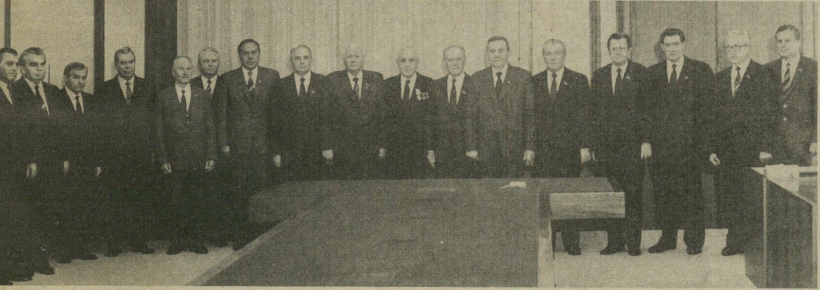
На снимке: при вручении награды.