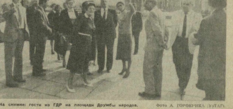
На снимке: гости из ГДР на площади Дружбы народов.