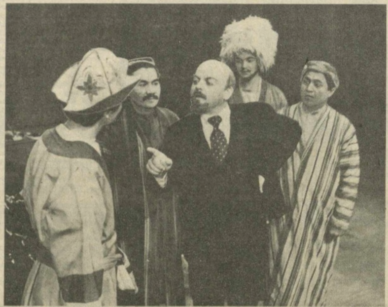
Творческий коллектив Хорезмского областного театра музыкальной драмы и комедии имени Агахи Исхакиевы...