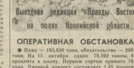
Выездная редакция «Правды Востока» на полях Навоийской области

Над полями летают самолеты сельхозавиации. Уже середина октября, а дефолиация продолжается в трех из четырех хлопкосеющих районов. Только хатырчицы развернули к этому времени массовую механизированную уборку хлопка. В большинстве же хозяйств Навоийского, Навбахорского и Кызылтепинского районов к ней еще не приступали.