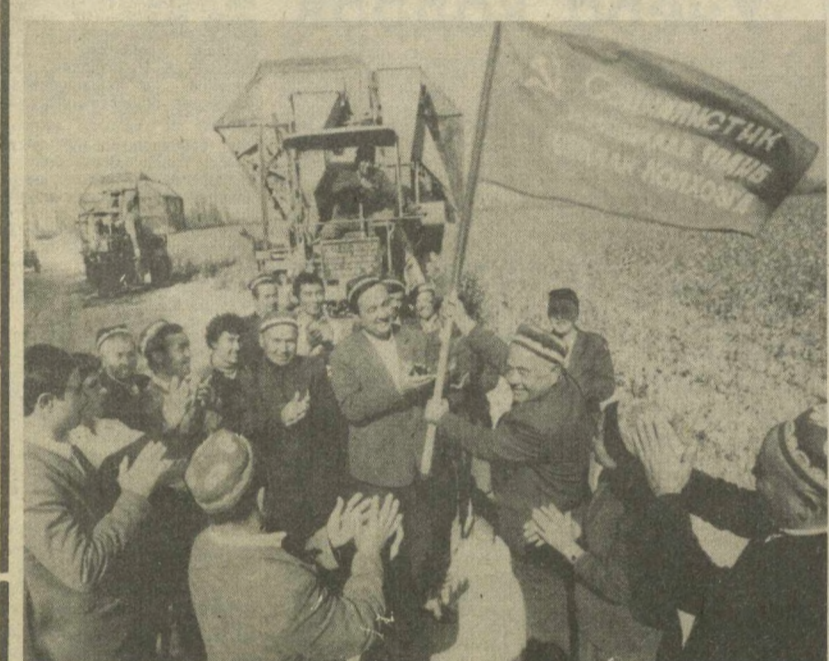
Нарынский район вторым в Наманганской области рапортовал о выполнении плана сдачи хлопка-сырца государству. Здесь лучших показателей в хлопкоборческой борьбе добивается коллектив колхоза имени Энгельса. Четкий ритм работ, их высокое качество позволили труженикам хозяйства завоевать и прочно удерживать районное переходящее Красное знамя. С начала сезона с площади

НАШ ИНТЕРНАЦИОНАЛЬНЫЙ ДОЛГ — ВЫПОЛНИТЬ ПЛАНЫ И ОБЯЗАТЕЛЬСТВА ЮБИЛЕЙНОГО ГОДА