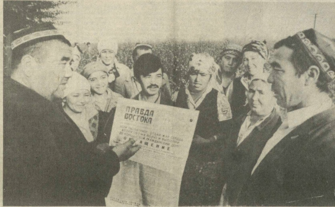
Труженники ордена Трудового Красного Знамени колхоза «Коммунизм» Янгйульского района горячо поддерживают Обращение ЦК Компартии Узбекистана, Президиума Верховного Совета и Совета Министров Узбекской ССР. Делом отвечая

Общие наши усилия — на быстрейшее выполнение планов и обязательств юбилейного года. Хлопковое поле зовет. И не может быть не услышан его голос: — Все на сбор хлопков!