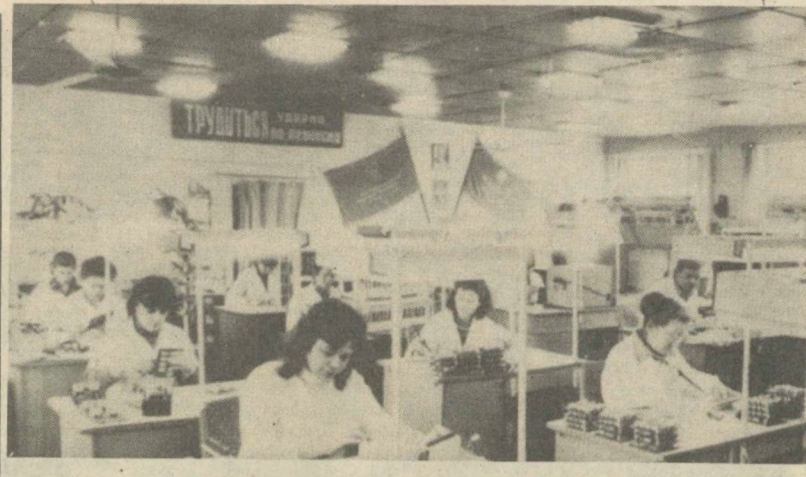
Серийный выпуск комплексного телемеханического устройства «Узбекистан», предназначенного для централизованного контроля и управления технологическими процессами на гидромеханических системах, начат в производственном объединении «Водрестроймаш» Госкомводстроя Узбекской ССР.

Указом Президиума Верховного Совета СССР от 22 ноября 1984 года 405 многолетним матерям, проживающим в Узбекской ССР, родившим и воспитавшим десять и более детей, присвоено звание «Мать-героиня» с вручением ордена «Мать-героиня».