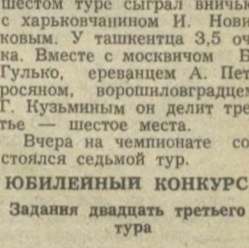
мат в три хода (3 очка)

После городского шума как-то охрипло чувствуешь себя на берегу Сырдарьи. Мы шли по дороге к реке и обратили внимание, что ее пересекли многочисленные следы змей. А ведь у них наступило время зимней спячки. Свернув с пути, мы подошли к яме, заполненной водой, и ахнули. Небольшая лужица буквально кишела мальками. Из-за скудности они не могли плавать, задышали от нехватки кислорода в воде. Тут были и красноперки, и маленькие сазанчики. Вокруг лужи колымом расплоскились пожиратели рыбок — лягушки — и змеи. Лягушки сидели с раздутыми животами, набитыми моллюсками. Они лениво вползали в яму и также лени-