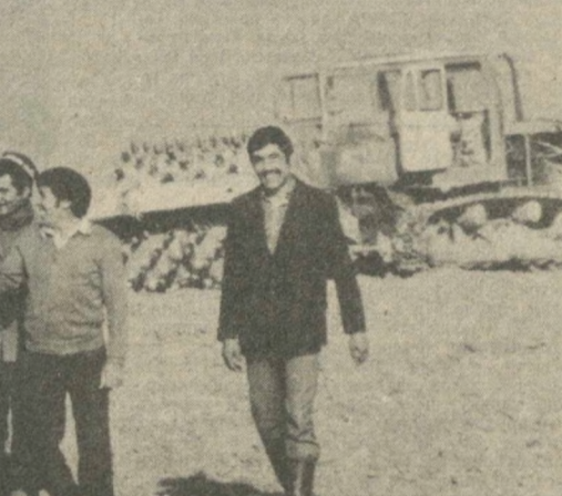
Каждый год в дни уборочной страды хлопководы поле служат для труженников автобазы № 12 Минавтоотрасли Узбекской ССР местом их проверки на гражданскую зрелость. Недавно за большие успехи в шефской помощи сельчанам автомобильной в очередной раз награждены переходящим Красным знаменем Гулистанского горкома партии и горисполкома. На счету этого коллектива свыше 70 тонн сырья, собранного в совхозе «Москва» Комсомольского района.

ФЕРГАНА. Сдав государству 33 тысячи тонн «белого золота», выполнили годовую план хлопководов земледельцы Ферганского района. 80 процентов от валового сбора принято первым сортом. В честь славного юбилея республики и Компартии Узбекистана хлопкоробы района обязались заготовить еще 2 тысячи тонн хлопка. САМАРКАНД. Труженники колхоза «Иттифоки Нарпайского района, собрав с каждого из 2,410 гектаров по 37,9 центнера хлопка, рапортовали о выполнении годового задания. В закром Родины поступило 9,135 тонн «белого золота». Более 90 процентов от валового сбора собрано первыми сортами. ГУЛИСТАН. Каждый год в дни уборочной страды хлопководы поле служат для труженников автобазы № 12 Минавтоотрасли Узбекской ССР местом их проверки на гражданскую зрелость. Недавно за большие успехи в шефской помощи сельчанам автомобильной в очередной раз награждены переходящим Красным знаменем Гулистанского горкома партии и горисполкома. На счету этого коллектива свыше 70 тонн сырья, собранного в совхозе «Москва» Комсомольского района. НУКУС. О выполнении высоких социалистических обязательств рапортовали рисоводы совхоза имени Чапаева Кунградского района.