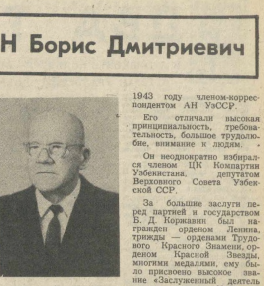
1943 году членом-корреспондентом АН УССР. Его отличали высокая принципиальность, требовательность, большое трудолюбие, внимание к людям. Он неоднократно избирался членом ЦК Компартии Узбекистана, депутатом Верховного Совета Узбекской ССР.

Многих выступавших — стерженщцу литейного цеха