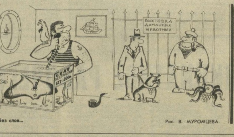
Рис. В. МУРОМЦЕВА.

ведрами сотни мальков, мы переходили на другую сторону дороги и выпускали рыбок в многоводный сброс. И так раз за разом, пока лужица не исчезла. Выливая содержимое ведер в прозрачную воду, заметили, что мальки не уплыли сразу, а широко разинув рты, проглатывали насыщенный кислородом воду. И лишь некоторое время спустя, медленно шевеля плавниками, направлялись вниз к Сырдарье. Особенно радовались мои юные спутники, поклавшие посмотреть вместе со мной краски ноября. Да, всегда и всюду найдется чем похвалиться родной природе. Важно только захотеть. И. ФАЙЗНОВ, г. Гулистан.