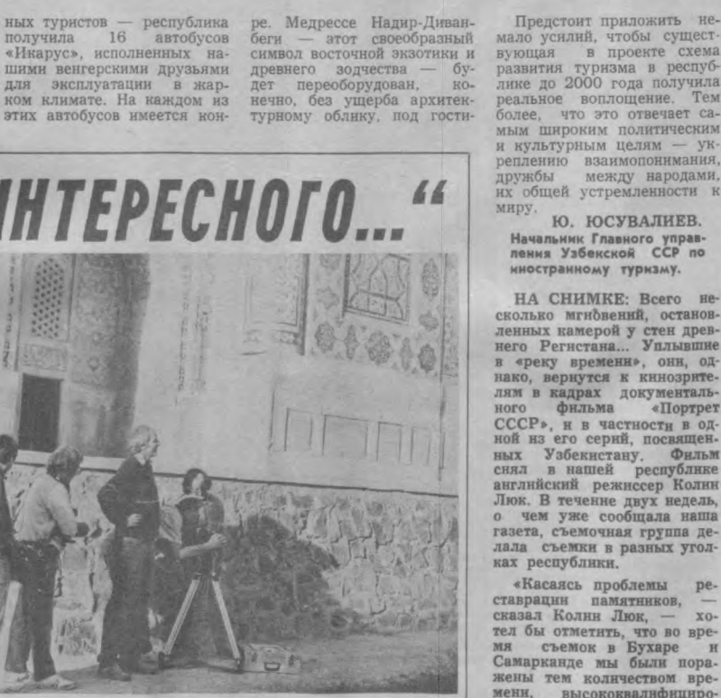
НА СНИМКЕ: Всего несколько мгновений, остановленных камерой у стен древнего Регистана... Улыбавшиеся в «реку времени», они, однако, вернутся к кинозрителям в кадрах документального фильма «Портрет СССР», и в частности в одной из его серий, посвященной Узбекистану. Фильм снят в нашей республике английским режиссером Колин Льюк. В течение двух недель, о чем уже сообщила наша газета, съемочная группа делала съемки в разных уголках республики.

«Касаясь проблемы реставрации памятников», — сказал Колин Льюк, — хотел бы отметить, что во время съемок в Бухаре и Самарканде мы были поражены тем количеством времени, высококвалифицированного труда, наконец, средств, которые затрачиваются на реставрацию этих городов. Я получил наслаждение, снимая на куполе Биби-ханым процесс облицовки голубыми плитками. А Регистан... Сегодня он выглядит грандиозно в сравнении с тем, каким мы его видели на фотографиях, сделанных 50 лет назад. Меня глубоко тронуло, что необходимость защиты разрушенных временем и климатом жемчужин архитектуры не только понимается, но и претворяется в жизнь постоянно».