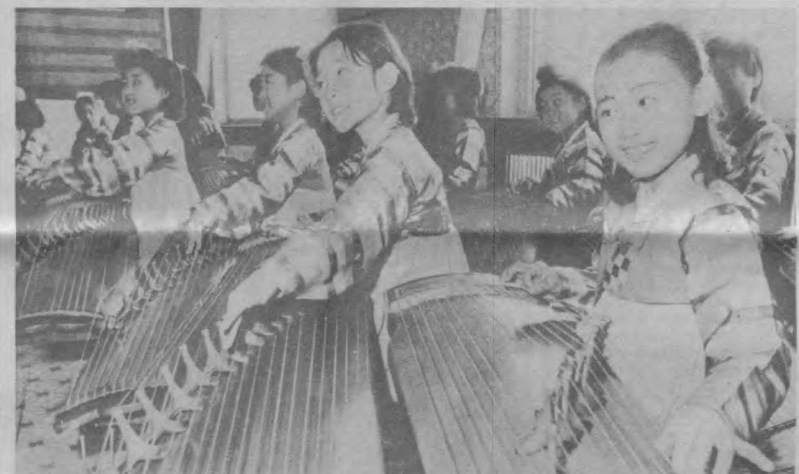
КНДР. Забота о счастье, здоровье, образовании подрастающего поколения страны — одна из важных задач республики.