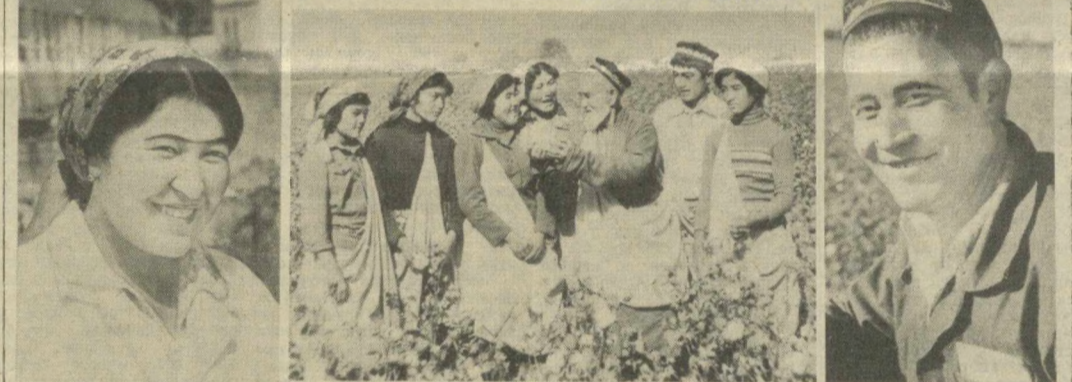
Это дети, внуки и правнуки тех, кто стоял у истоков колхоза имени Ленина. Они гордятся своим происхождением и стараются не уронить чести славного коллектива. Они многое знают, многое умеют и многого достигли. Перепроходцы мечтания о трех тракторах. Сегодня в колхозе более ста различных машин. Даже в лучшие сезоны радовался тут тогда 12—14-центнерному урожаю, в этом сезоне в колхозе сняли на круг более 40 центнеров. Намного больше, чем планировалось, произведено в колхозе коконов, зерна, мяса, молока, другой продукции. Колхоз давно ходит в «миллионеры».