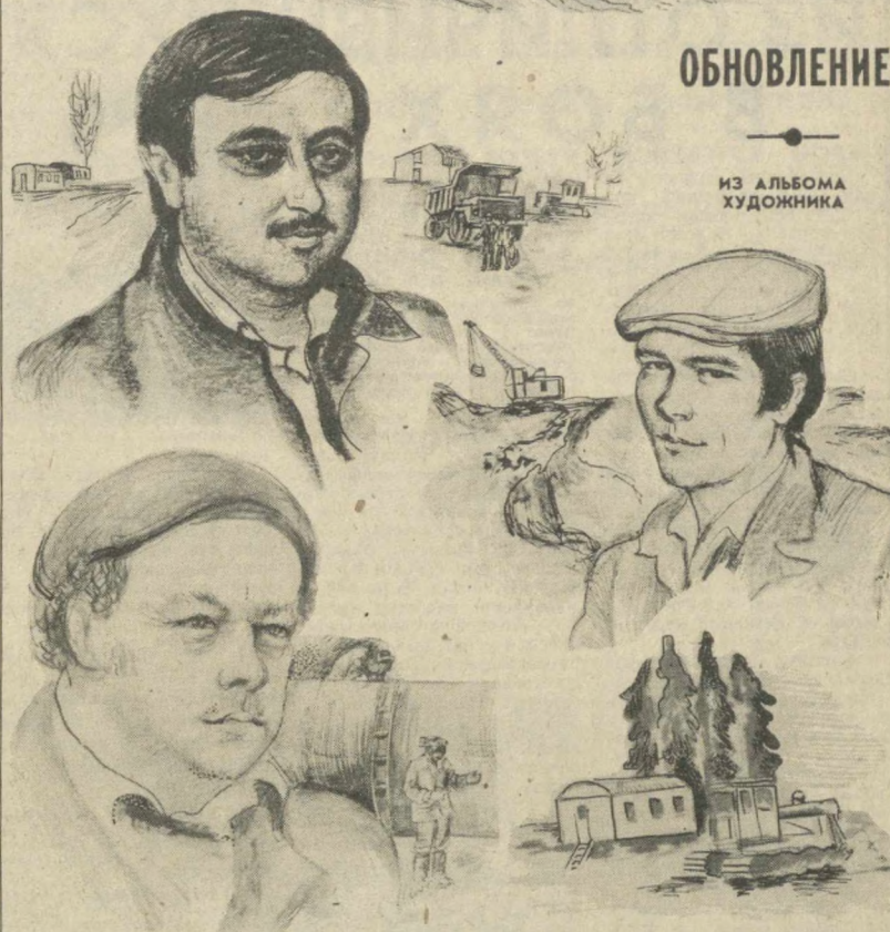
ИЗ АЛЬБОМА ХУДОЖНИКА

Чирчик. Это слово сегодня знакомо каждому, потому что связываем мы с ним представление о воле человека, его силе преобразования природы. Болотистые низины, мелкие реки, разрезающие поля овраги — такая была владимирская земля долгие годы. С приходом сюда мелиораторов многое изменилось. Обширные площади пахотных земель уже дают первые урожаи. Хлеб — всему голова, говорят земледельцы. А хлеб, выращенный на вновь освоенных землях, ценен особо. Ведь в него вложено труд тысяч людей. И среди тех, кто по зову партии приехал в Нечерноземье преобразовывать этот древний край, — посланцы нашей республики.