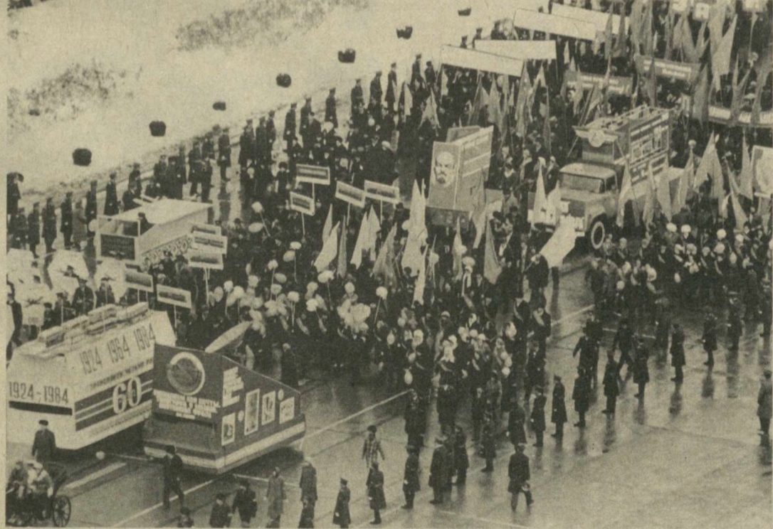
Ташкент. Площадь имени В. И. Ленина.

Всесом вклад Узбекистана в укрепление оборонного могущества Советской Родины, в дело защиты завоеваний Октябрьской революции, Сыны и дочери Узбекистана, как и все советские люди, не на жизнь, а на смерть сражались с фашизмом в годы Великой Отечественной войны, показывая образцы героизма и стойкости. Они самоотверженно трудились в тылу во имя Победы.