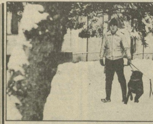
По первому снегу.