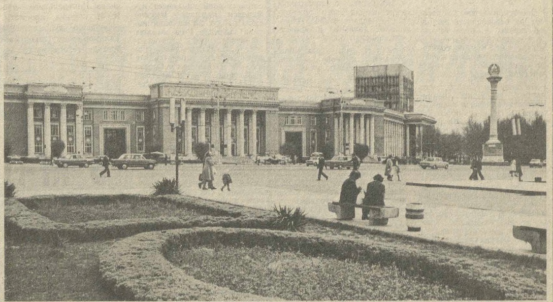
Столица Таджикской ССР г. Душанбе. Площадь имени В. И. Ленина.