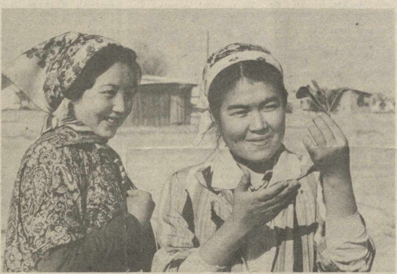
Ангор районидagi «Ленин йўли» совхози миришкорлари эртак сабаот экинлари кўчатини етиштиришга доимо катта эътибор беришади...