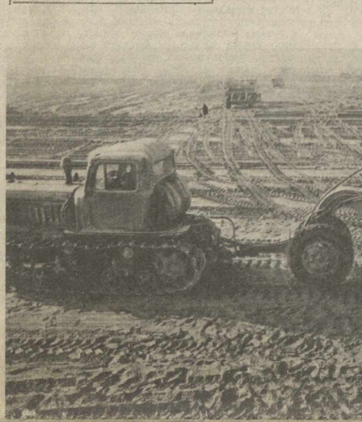
ДИҚҚАТ: ЯНГИ АНГРЕН ГРЭСИ ИШГА ТУШДИ

РЕСПУБЛИКАМИЗ МЕХНАТКАШЛАРИ УН БИРИНЧИ БЕШ ЙИЛЛИК НИНГ СЎНГИ ЙИЛИ ТОП ШИРИҚЛАРИНИ ШАРАФ БИЛАН БАЖАРИШ УЧУН КУРАШМОҚДАЛАР.