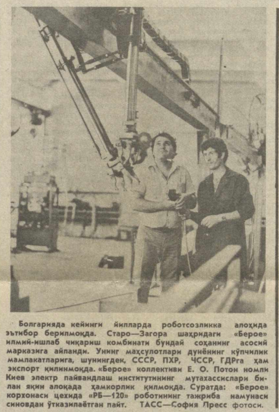
Болгарияда кейинги йилларда роботсозликка алоҳида эътибор берилмоқда. Старо-Загора шаҳридаги «Беро» илмий-ишлаб чиқариш комбинати бундай соҳанинг асосий марказига айланди.

18 ФЕВРАЛЬ, ДУШАНБА МОСКВА-1, 9.00 — Время. 9.40 — Мультифильмлар. 10.15 — Тулпор, қурол ва арқан шомол. Вадий фильм. 11.20 — Хужжатли фильмлар. 11.55 — Романслар. 12.15 ва 15.00 — Янгиликлар. 15.20 — Хужжатли фильмлар. 15.55 — Ватан посбони бўлиб. 16.45 — Фильм-концерт. 17.25 — Даллат хонимият органлари системаси ҳақида. 18.00 — Ўзбекистонда югуриш бўлиши жаҳон чемпиони. 18.45 — Сиз яратган боғ. 19.15 — Дунё воқеалари. 19.35 — Ишлар ва одамлар. 20.05 — Халқ куйлари. 20.25 — Ватан оғли ўт Учиришга руҳлат ебериш. Вадий фильм. 19.59 — Время. 22.05 — Поэзия. 22.30 — Концерт. 22.55 — Енгил атлетика бўлиши СССР чемпиони. 23.25 — Дунё воқеалари. МОСКВА-11, 9.00 — Гимнастика. 9.15 — Илмий-оммабол фильм. 9.55 — Ленин таъсис