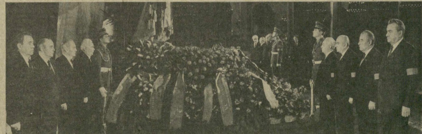
На снимке: в почетном карауле — руководители Коммунистической партии и Советского государства.

Через каждые три минуты меняется почетный караул. В траурной вахте у гроба — заместители Председателей Президиума Верховного Совета СССР и Совета Министров СССР, руководители министерств и ведомств, маршалы Советского Союза и родов войск, генералы, адмиралы, офицеры Советской Армии и Военно-Морского Флота, руководители партийных и советских организаций Москвы и Московской области, передовики произ-