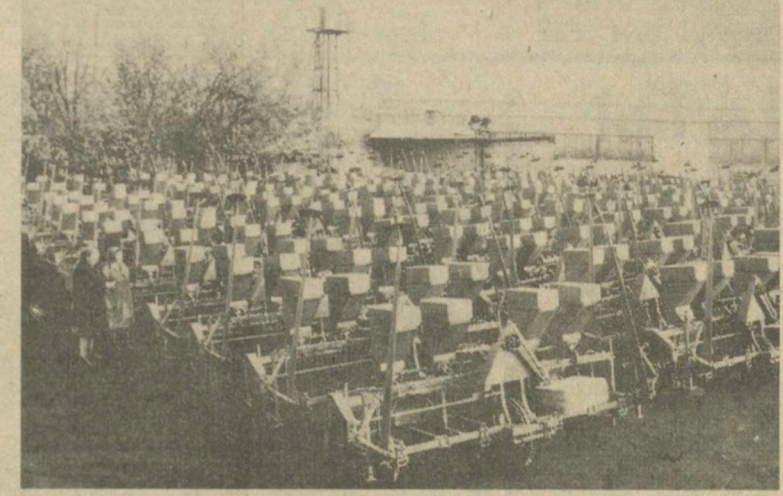
Очередная партия универсальных хлопковых сеялок СХУ-4 отправлена производственным объединением «Узбексельмаш» хлопкорам Каракалпакии. Сеялки оснащены электронноследящей системой «Медар-1», которую поставляют объединенные предприятия Болгарии. Использование СХУ-4 дает хозяйствам большой экономический эффект, повышает темпы и качество сева. Уже произведено более 4,5 тысяч сеялок. На снимке: очередная партия сеялок подготавливается и отправляется.