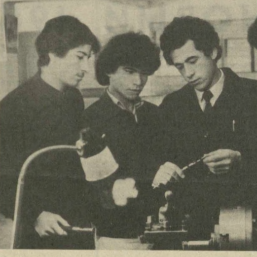
Мастер производственного обучения — эту профессию в Ташкентском индустриально-педагогическом техникуме профтехобразования № 1 осваивают свыше 350 учащихся...