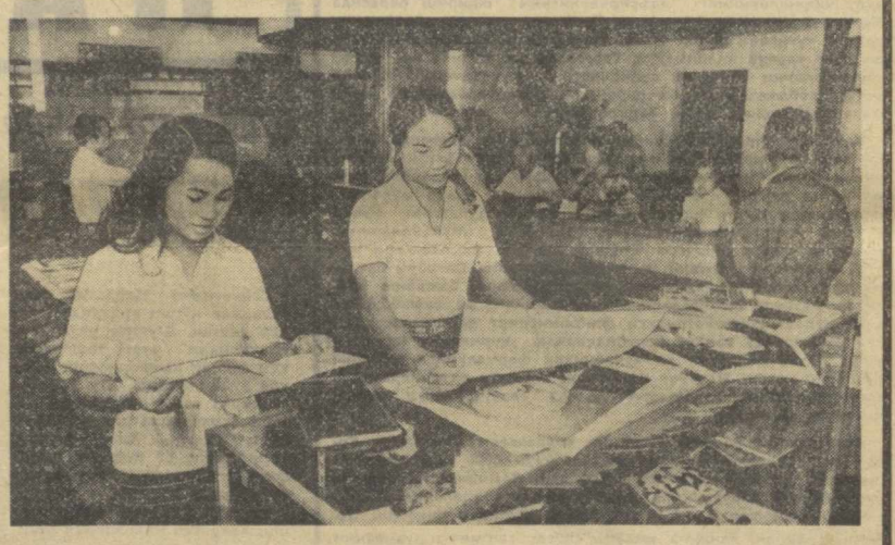
ЛХДР. Вентильда республи- нада биринчи давлат китоб ма- газини очилди. Унда фан ва техника, маданият ва санъат бадий ва болалар адабиёти бўйича 35 мингга яқин китоб

Шаҳар марказидаги Маркс-Энгельс-плац майдони- да ойна ва бетондан қурил- ган бу муҳташам бино ҳам- мавинг диққатини ўзига жалб этади. Саройнинг ички бинолари қўлай ва шинам. Бу ерда меҳнаткашларнинг дам олиши ва маданий ҳор- диқ чиқариши учун ҳамма шароитлар яратилган. Дра- матик санъат муҳлислари сарой театрининг спектакл- ларини томоша қилишлари мумкин. Тўрт минг ўринли залда эстрада ўз ишқибоз- ларига хизмат қилмоқда. Бу ерда концертлар қўйиб бе- рилади. (ТАСС).