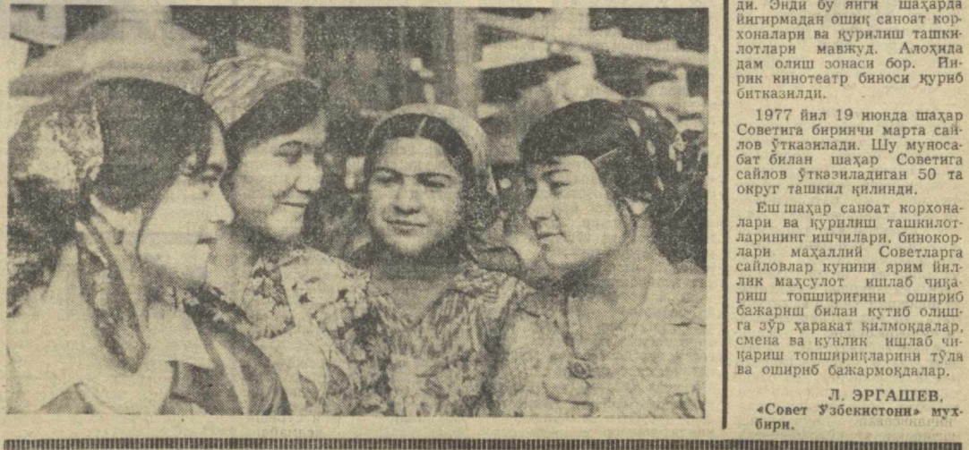
Аҳолига маънавий хизмат кўрсатишни яхшилаш