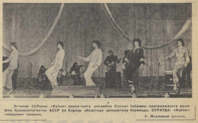
Эстония ССРининг «Лайне» вокал-оркестр ансамбли Санъат байрами программасига мувофиқ Қорақалпоғiston АССР ва Хоразм областида концертлар берамоқда. СУРАТДА: «Лайне» чиларининг ичкиши.

— Сизнинг коллективингиз санъат байрамидан нималар кутмоқда? — Энг аввало шунки алоҳида таъкидлашимиз керакки, бизнинг оркестр биринчи марта бундай кенг кўламли санъат форумида иштирок этамоқда. Шубҳасиз, барчамизни баб-барвар қувонтиради. «Дўстлик тароналари» деган кўп нарса кутмоқчимиз. У биринчи гада қардош республикалардан бу ерта ташриф буюрган машҳур бандий коллективлар билан мустаҳкам алоқа боғлаб, ижод қилишимизга имконият беради. Учрашувимиз яна шунинг учун ҳам қатъий, биз Улуғ Октябр социализмнинг революциясининг кутлуг 60 йиллиги ара-