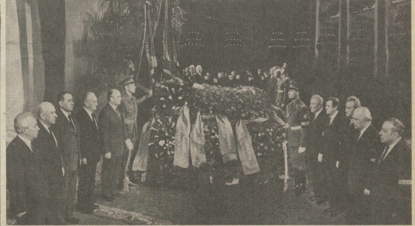
Коммунистик партия ва Совет давлатининг раҳбарлари фахрий қоровулликда.

Совет кишилари КПСС Марказий Комитети навбатдан ташқари Пленумининг қарорини, КПСС Марказий Комитети, СССР Олий Совети Президиуми, СССР Министрлар Советининг Коммунистик партияга, совет халқи Мурожаатининг қизғин маъқуллаб кутиб олдилар. Улар партия ва давлатнинг атоқли раҳбари билан видолашар эканлар, юксак онглилик ва уюшқорлик намуналарини кўрсатиб, янада зўр ғайрат-шижоат ва фидокорлик билан меҳнат қилмаш, Ватанимизнинг иқтисодий ва муҳофаа қудратини мустаҳкамлашга, Улуғ Октябрь байроғини муносиб равишда баланд кўтариб борамиз, деб ваъда бердилар. (ТАСС)