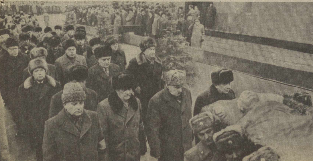
К. У. Черненко дафн этиш маросимида.