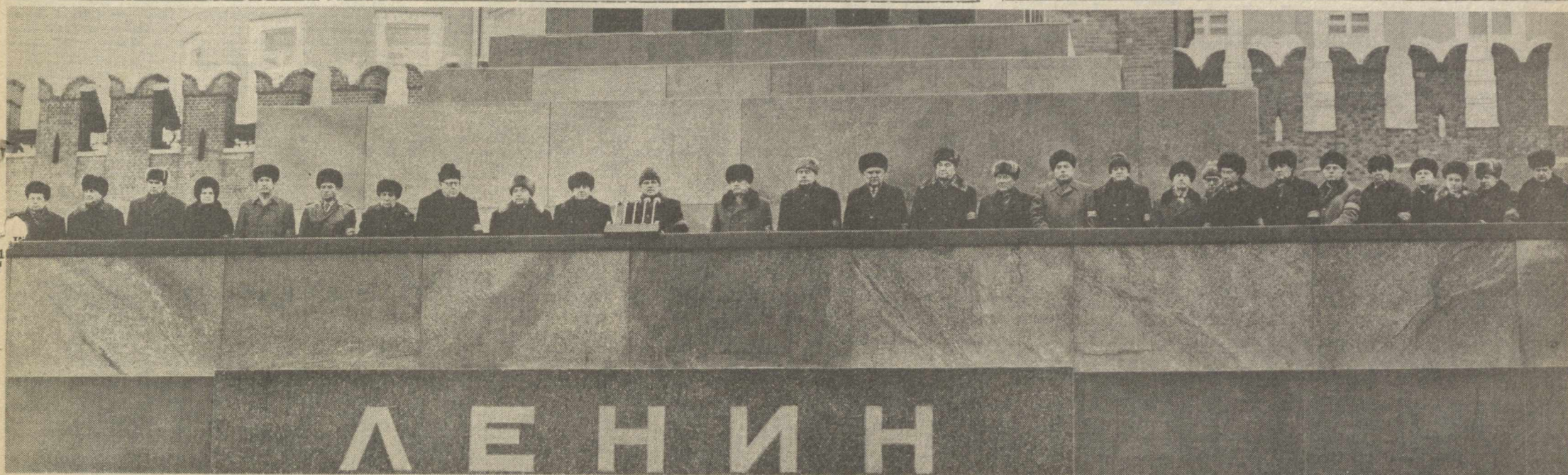
Москва, 1985 йил 13 март. В. И. Ленин Мавзолеи минбарига.

Советлар мамлакати меҳнаткашлари Коммунистик партия ишига садоқат билан хизмат қилиш, унинг кўрсатмаларини сабот билан амалга оширишга аزم қарор қилганликларини изҳор этмоқдалар.