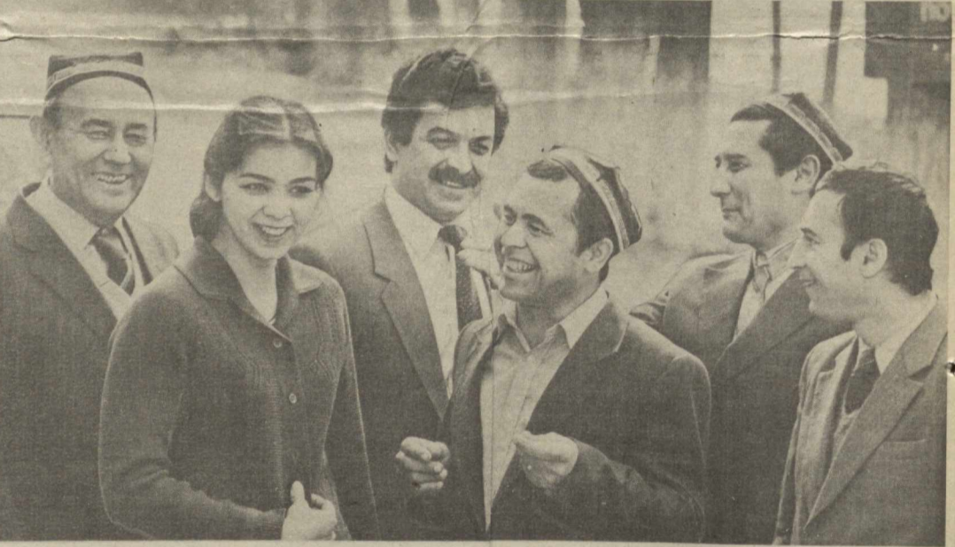
Суратда: Тошкент шаҳрида аҳолига маиший хизмат қилаётган соҳасида меҳнат қиларган илгорлардан бир гуруписи (чапдан ўнгга) соат-

Ушбу ҳафтада ҳам шунга ўхшаш ишлар бажарилади. Республиканинг шаҳар ва қишлоқларининг санитария ҳолатини талаб даражасида сақлаш бўйича ўтказилган ишчи ойда 5 миллиондан зиёд киши иштирок этди.