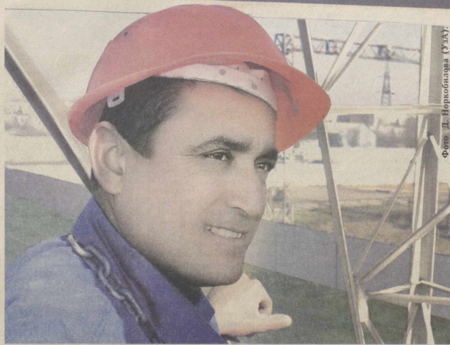
Фото Д. Норкobilова (УзА).

Каждые несколько лет на поверхности Мирового океана появляются новые участки суши вулканического происхождения, однако не все они оказываются в состоянии противостоять волнам и ветру. Бассейн Красного моря насчитывает несколько десятков островных образований, большинство из которых имеют вулканическое или коралловое происхождение.