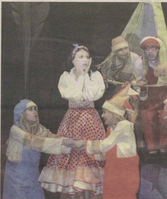
Сцена из спектакля "Белоснежка и семь гномов".