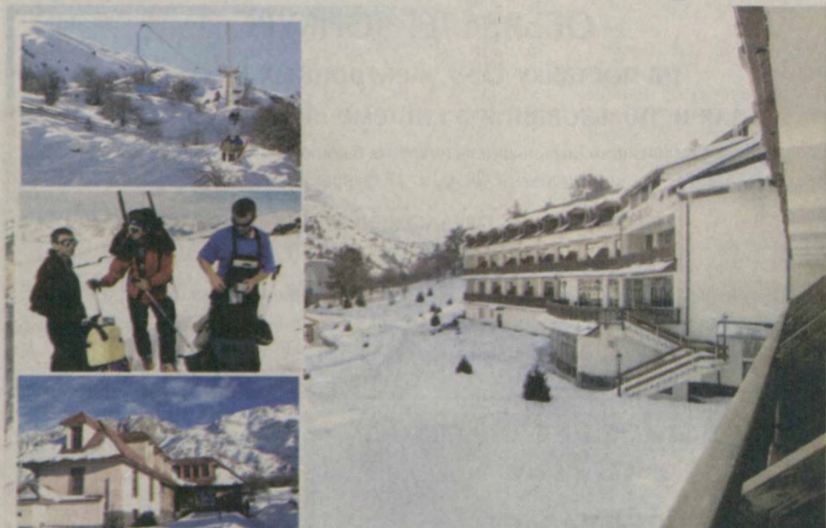
В оздоровительном центре "Beldersoy oromgohi".

Прекрасные условия для активного отдыха туристов созданы в оздоровительном центре "Beldersoy oromgohi". Это живописное урочище раскинулось недалеко от Чимгана, всего в часе езды от Ташкента. Чистый морозный воздух, снег по колено и отличные лыжные