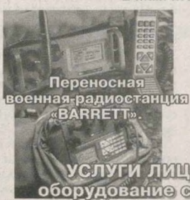
Переносная военная радиостанция «BARRETT»

имеет возможность поставки оборудования фирм «BARRETT» и «Q-MAC» за сумы РУз по биржевому курсу из Австралии для гражданских предприятий, военизированных организаций, органов внутренних дел и др. Адрес: 100100, г.Ташкент, ул. Ш. Руставели, д. 60, кв. 1. Тел./факс: (99871) 253-02-76, 253-31-76. E-mail: kvant@tps.uz