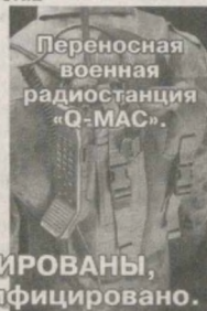
Переносная военная радиостанция «Q-MAC»

УСЛУГИ ЛИЦЕНЗИРОВАНЫ, оборудование сертифицировано.