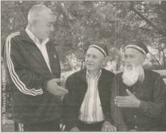
сещают площадь Памяти, комплексы Хастимова, Памяти жертв репрессий, Зангиюта, Государственный музей истории Темуридов и т.д.

С учетом пожеланий пациентов разработан план различных культурно-просветительских мероприятий. Ежедневно в клубе санатория организовываются концерты, встречи с творческими людьми. С участием специалистов Минздрава проходят "круглые столы", семинары по профилактике заболеваний. Совместно с автобусным парком № 8 организуются экскурсии по памятным и достопримечательным местам столицы. Ветераны по-