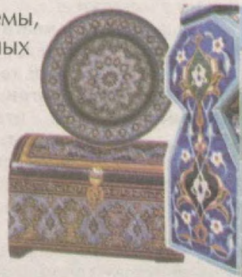
Много ли в наше время передовых технологий и рыночных отношений может сделать умелец-одиночка?