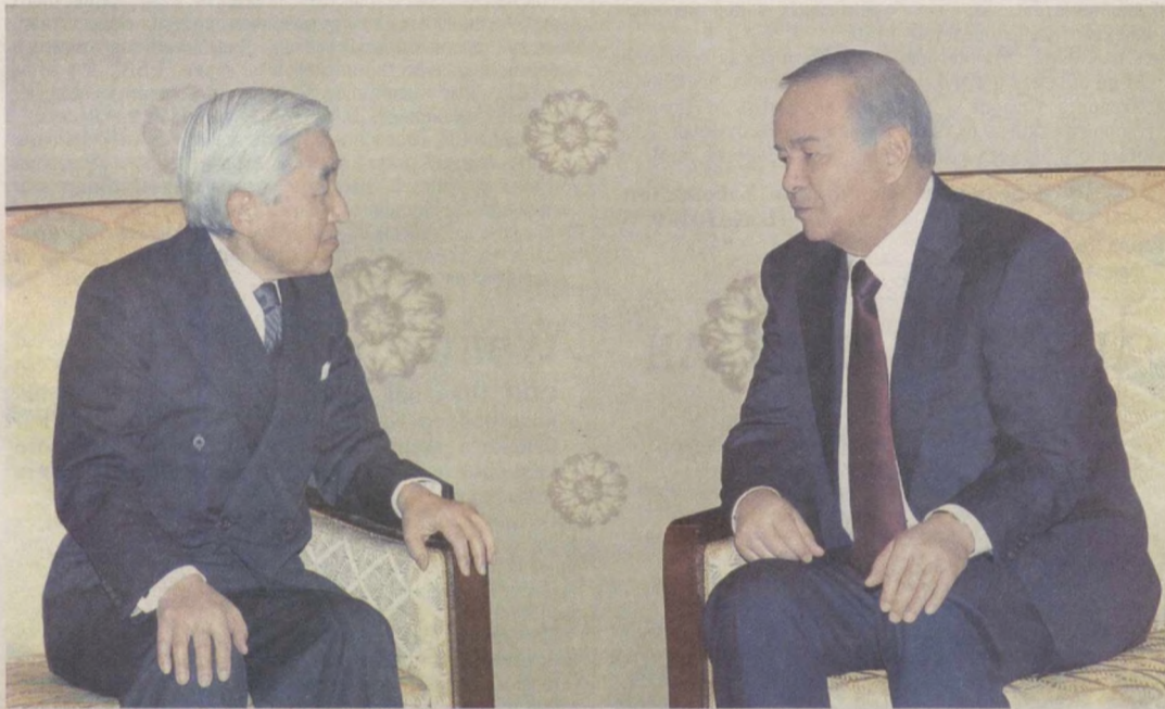
Проекты и свершения