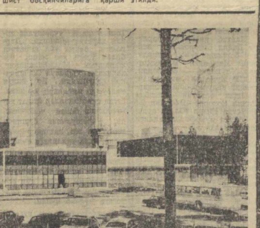
Финляндиянинг қурувчи-инженерлари иттифоқи совет мутахассисларининг ёрдамида Ловенсда қурилган биринчи фин атом электростанцияси 1977 йилнинг энг яхши курилик объектн, деб эътироф этди. Суратда: Ловенсдаги атом электростанцияси.

ЮСФР Скупшқинисининг Раиси К. Глигоров ЮСФР Президенти Йосиф Броз Титога Югославия Халқ қаҳромони унвонини орденини тошқиди. Жуда катта хизматлари ҳамда Югославия халқларининг фахрид босқинчиларга қарши