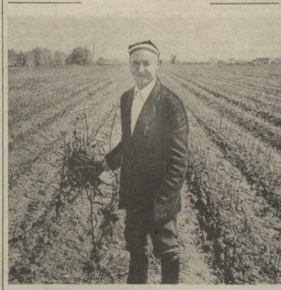
Хўрматли газетхон бу сурат кўзда — пахта йиғим-термини тугаллаш сўрагани билан керак, деб ўйлар. Асло ундай эмас. Суратда чигит экиш массуми авж олиб кетган ҳозирги дамларда Жомбой районидagi «Жомбой» совхоз далазининг аҳволи тасвирланган.

Хуллас, текшириш давомида чигит экиннинг бориши ҳақидаги сохта маълумотлар билан жойлардаги ҳақиқий аҳвол ўртасида катта фарқ борлиги аён бўлди.