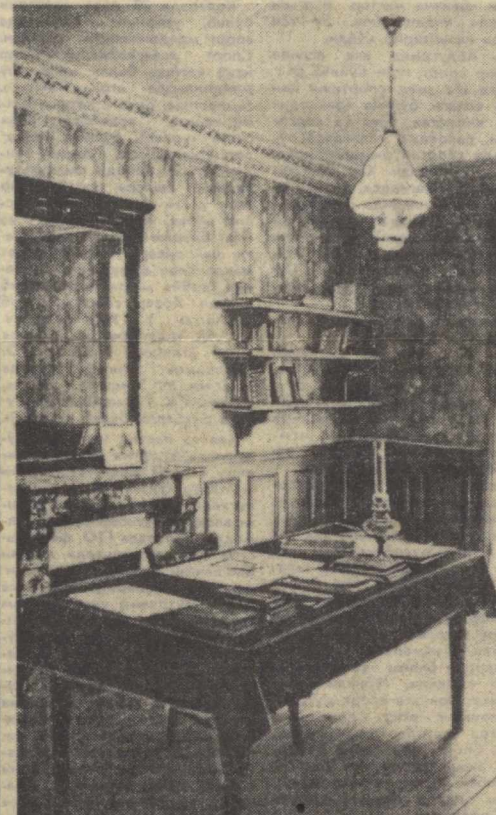
Франция, Парижнинг Мари-Роз кўчасидаги 4-уйини учинчи қаватдаги квартира В. И. Ленини музейига айлантирилган. Владимир Ильич муҳожирликда 1909 йил июлдан 1912 йил июнчигача шу ерда яшаган бўлиб, ўша даврда квартира рус революциясининг чинакам штаби бўлиб қолган. Пролетарият доҳисининг чорамга қарши курашга сафарбар этуви кўнгинга асарлари ҳам шу ерда ёзилган.

«СССР Олий Советининг сессияси ҳақиқатан ҳам тарихий сессия бўлди», — деди Л. И. Брежнев, деб ёзади газета, бундан бундан давлат бошлиғи сифатида ташқи сиёсат соҳасидаги ишларга янада кўпроқ эътибор берилади. У халқаро кескинликни юмшатиш дипломатиясини мустаҳкамлашга ҳаракат қилмоқда. Шарқ билан Габар ўртасидаги кескинликни юмшатиш дипломатиясини барқарор йўлга солиш учун Л. И. Брежнев шахсан совет дипломатиясининг олдинги сафларида борини зарур. Л. И. Брежнев ана шу дипломатиячи барқарор йўлга солиш учун курашмоқда. Л. И. Брежневнинг КПСС Марказий Комитети Бош секретари Президентини Раисини лавозимларини эгаллаш зарур бўлиб қолди, деб ўтириб ўтди «Майнинг» газетаси.