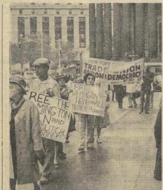
АҚШ хўнрон доираларининг ризиқорона сиебати Америка жамоатчилигида кескин норозилик уйғотмоқда. Бу доираларда «иссон хуқуқлари» тўғрисида тинмай оғиз кўлтирилса-да, амалда меҳнатшарнардон ҳақий хуқуқларини чеклаш нучайтирилиб, илгор фирман ишчилар қаттиқ таъкир остига олинмоқда. Суратда: Нью-Йорк жамоатчилиги «АҚШдаги барча сиебий махбусларга озолик», «Уилмингтонинг Унлар» дарҳол озолик қилинсин!» деган шюорлар остида намоийш ўтказилмоқда.

мамлакат ўртасидан бази ичкилофларни бартарф қилишга ёрдам берди. Бош министр Бхутто шу сафар вақтида мусулмон мамлакатларининг ҳарбий иштирокчи ва мусулмонлар дунёсидан келиб чиқадиган ичкилофлар ҳамда ниллий масалаларини ҳал этиш учун «доний ишқил» механизминини тузиш тўғрисида такир киритди.