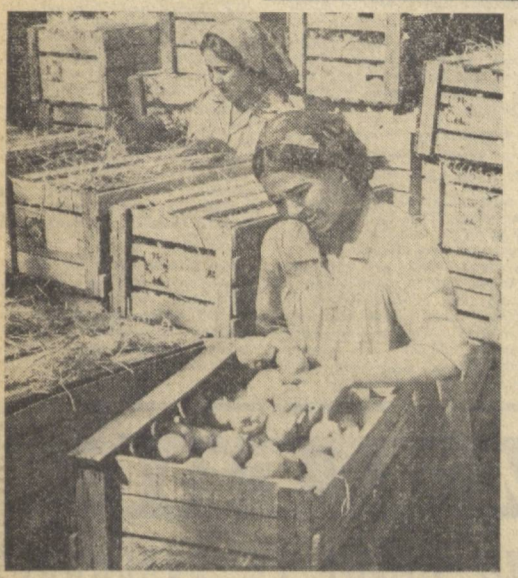
КИЧИК ШАХАРЛАР ИСТИҚБОЛИ