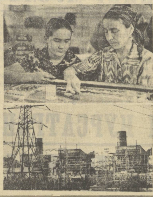
Областа капитал қурилиш ҳажмининг ўсиши (1966 йилга нисбатан)...

Бухоро областа санюати тез суръатлар билан ривожланиб борапти. Бу ерда санюатнинг янги даражаси соҳалари аумуғда келмоқда.