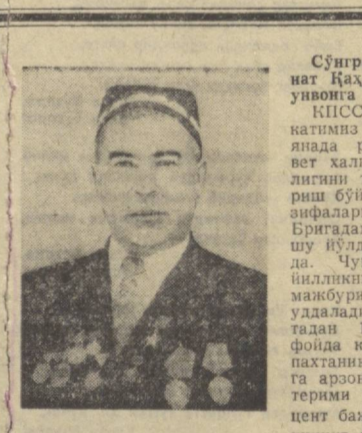
Совет турмуш тарзи