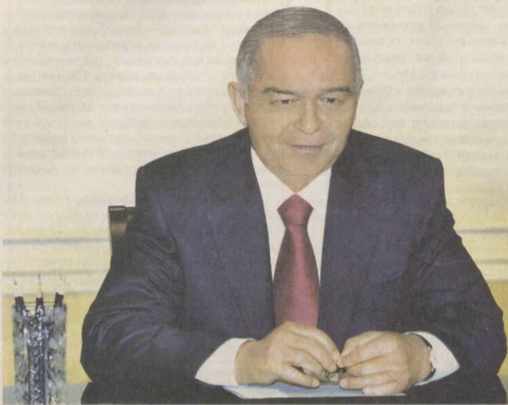
Президент Республики Узбекистан Ислам Каримов 16 мая в резиденции Оксарой принял президента Международной футбольной федерации (ФИФА) Йозефа Блаттера.

Приветствуя гостя, глава нашего государства отметил, что в Узбекистане Йозефа Блаттера знают в качестве видного общественного деятеля, посвятившего себя развитию мирового и национального футбола. Нынешний визит руководителя ФИФА в Узбекистан является третьим по счету и совпал по времени с праздни-