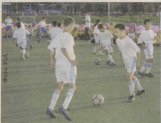
"Умид нихоллари" будут состязаться спортсмены по художественной и спортивной гимнастике. Универсальность зала по художественной гимнастике в том, что он приспособлен под занятия волейболом, ручным мячом, мини-футболом. Больше одного миллиарда сумов выделено ОАО "Навоизот" на реконструкцию стадиона "Химик", на базе которого состоятся матчи по футболу и ручному мячу. Отремонтированы спортзалы и площадки, силами работников "Навоизота" обновлены оборудование и инвентарь. В цехах

Дильфуза Гулямова. Соб. корр. "Правды Востока". Навоийская область. Таджи Тимуров.