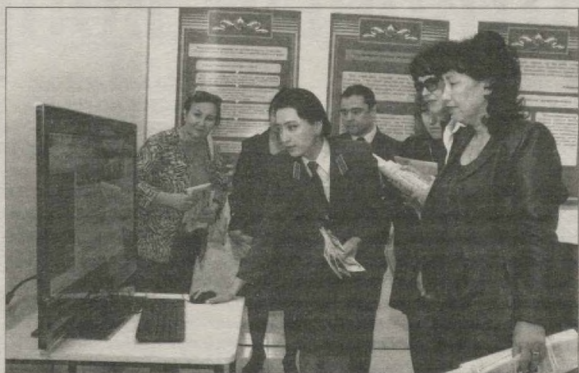
Консультация для налогоплательщиков.