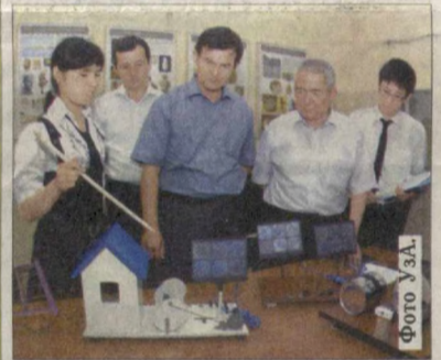
Смотр-конкурс в Сурхандарьинской области.

тысяч юношей и девушек. Всего общее число участников конкурса за все годы достигло 388 тысяч.