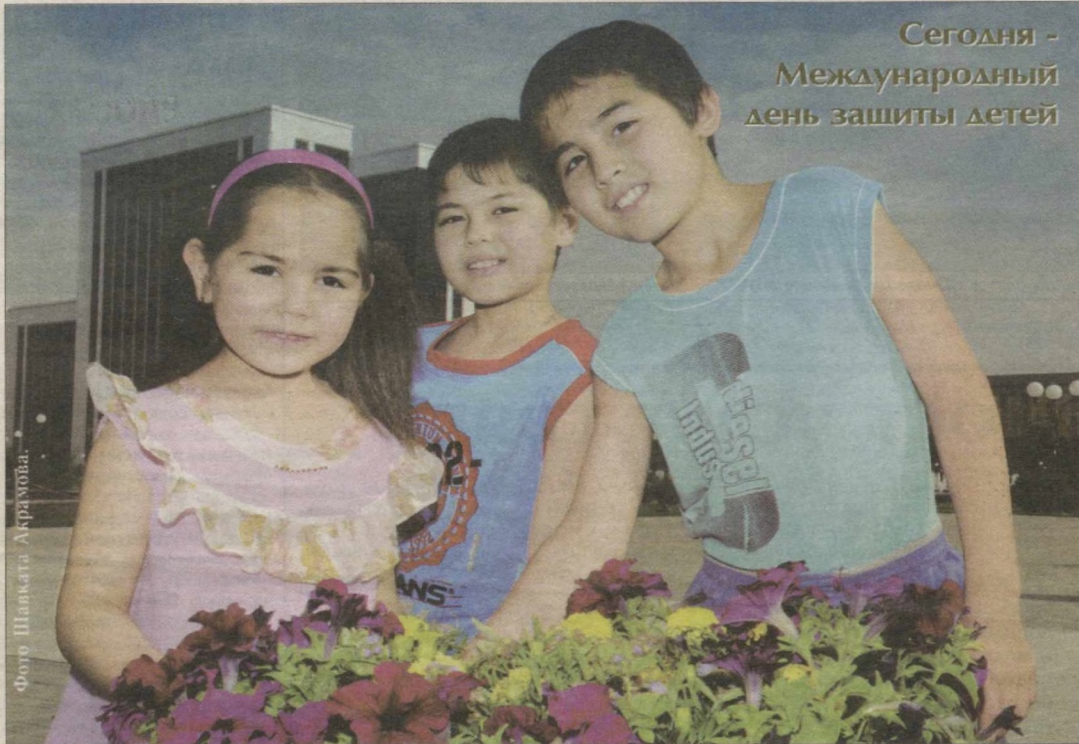
Фото Шанкати Акрамба.

Сегодня - Международный день защиты детей