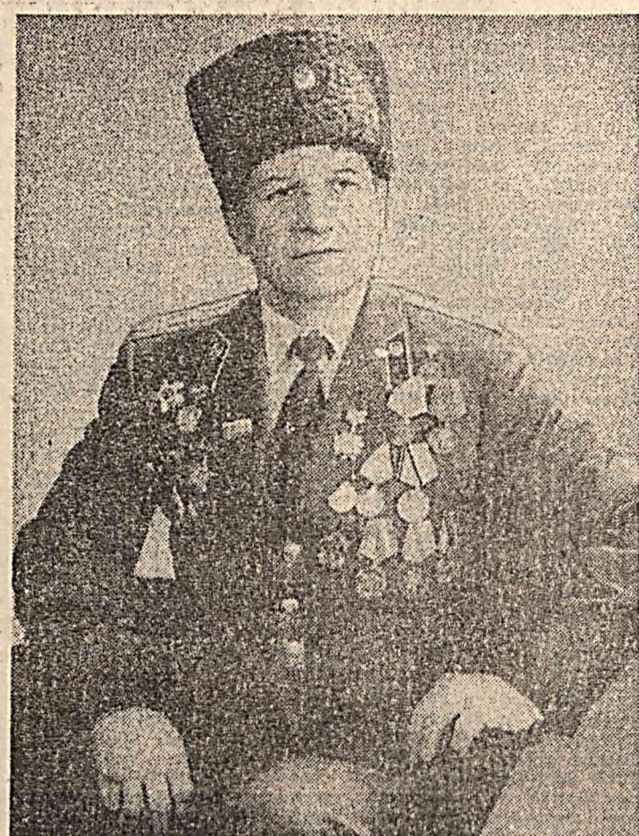
Сборник «О военно-патриотическом воспитании молодежи» составлен из мнений и рассказов, опубликованных в разное время в газете и журнале. Он носит документальный характер. В нем речь идет о судьбах соотечественников — ветеранов войны, их героическом прошлом и настоящем.

Многие читатели знают о нем по многочисленным публикациям. Наша встреча с этим замечательным человеком прошла накануне его юбилея — 5 марта ему исполняется 80 лет.