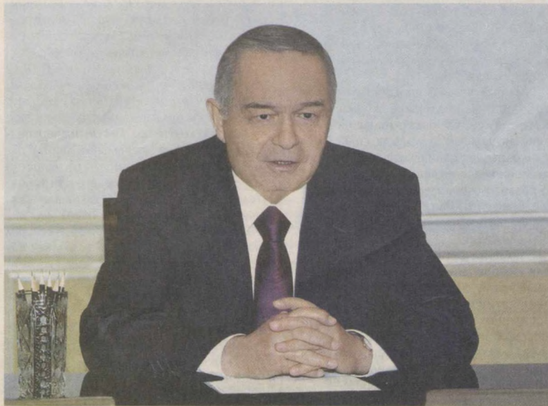
Президент Республики Узбекистан Ислам Каримов 12 июня в резиденции Оксарой принял Уильяма Бернса, первого заместителя Государственного секретаря Соединенных Штатов Америки.

Приветствуя гостя, глава нашего государства с удовлетворением отметил растущую динамику и последовательное укрепление многопланового узбекско-американского партнерства.