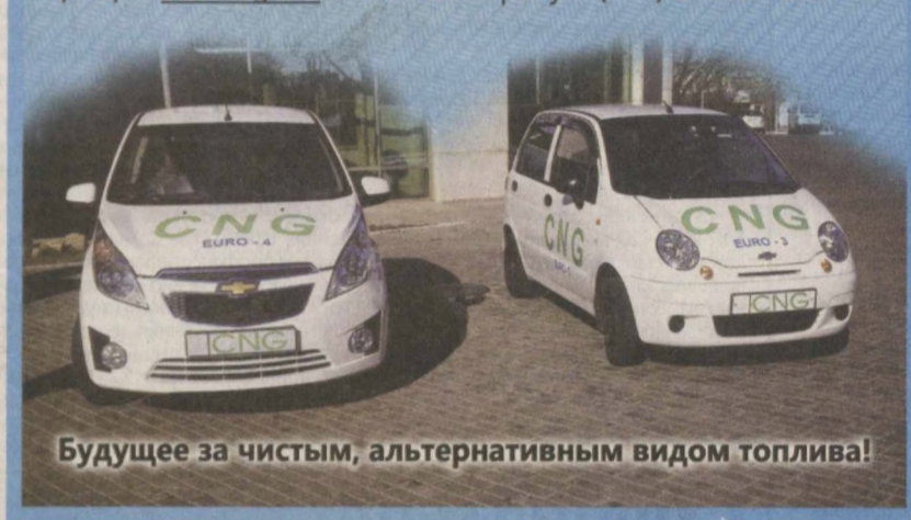
Будущее за чистым, альтернативным видом топлива!

Подробную информацию можно получить на сайте ассоциации www.ngv.uz или по телефону 8 (371) 291-84-04.