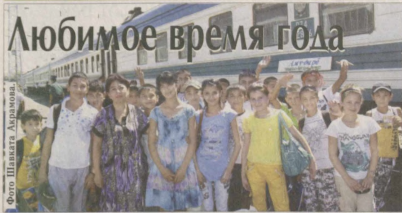
Летние каникулы вступили в свои права. И детские оздоровительные лагеря работают в полную силу, принимая своих маленьких гостей.

Особое внимание в этом году уделено отдыху и оздоровлению детей из Приаралья. Согласно Госпрограмме "Год семьи" более 4400 мальчиков и девочек из Каракалпакстана и Хорезмской области смогут отдохнуть по бесплатным путевкам в лагерях "Алокачи" в Джизакской области, "Золотинка" - Самаркандской, "Транспортный авлод", "Конструктор", "Тунча", "Машаля", "Билдирсой", "Нурафшон", "Меҳржон", "Иулчи", "Кониот", "Зангори олов", "Бойчечак" и "Тулбахор" - Ташкентской, а также "Лочин" - Кашкадарьинской области.